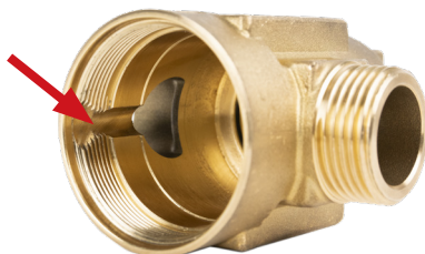
Рис. 2. Желоб внутри клапана