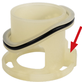
Рис. 1. Направляющий выступ на смесительном элементе

Направляющий выступ на смесительном элементе (Рис. 1) должен быть помещен в специально подготовленный желоб внутри клапана (Рис. 2). Только такая установка (Рис. 3) гарантирует правильную работу клапана.