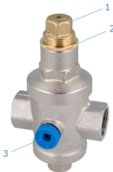
Рис. 2: Конструкция редуктора BPR

Для правильной настройки выходного давления рекомендуется установить манометр, чтобы считывать значение давления, установленное на выходе клапана.